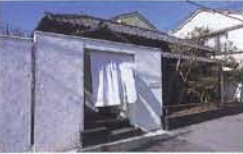
上：白いれんがが美しい入口。左：ランチタイムの「地魚と茶あげしらすのどんぶり」。小鉢、香の物、コーヒーなどがセットで1,650円。