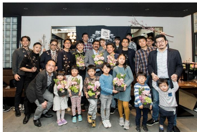
※ワークショップイメージ